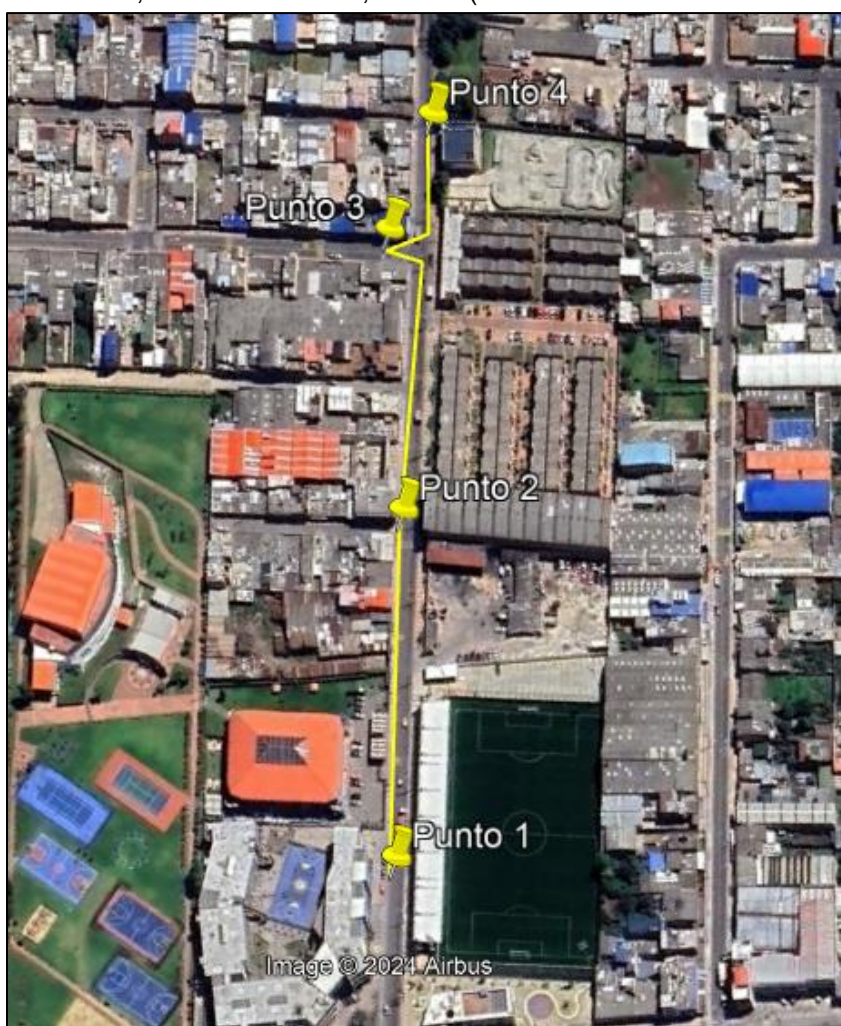
Ilustración 1. Recorrido verificación ambiental

Con base en lo anterior, el día 24 de octubre de 2024 se realizó recorrido de control y vigilancia en el barrio México desde las coordenadas 4°42'36,45"N- 74°12'22,35"W hasta las coordenadas 4°42'39,828"N- 74°12'13,626"W (ver ilustración 1. Ruta amarilla).